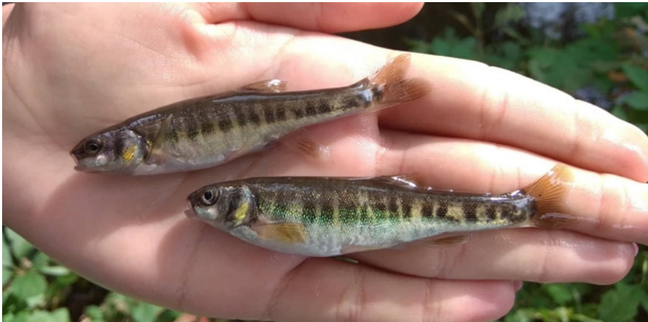
2. ábra. Fűrge csellék a Gönci-patakból Fig. 2. Eurasian minnows from the Gönci brook

A kapott értékek a Lapis-, illetve a Hasdát-patak esetében jól mutatják, hogy mivel halfaunájukat csupán egy halfaj (kövicsík) alkotta, ebből adódóan nem beszélhetünk halfaunájuk diverzitásáról. A többi vízfolyás esetén többségében viszonylag magas diverzitás mutatkozik az eredmények alapján, azonban ezen eredmények értékelésénél figyelembe kell vennünk, hogy a hegy- és dombvidéki kisvízfolyások halközösségét rendszerint csupán néhány faunaelem alkotja, s a látszólagos ún. pszeudodiverzitást gyakorta generalista, vagy akár idegenhonos, inváziós fajok megjelenése is okozhatja (Halasi-Kovács & Tóthmérész 2011, Sály & Erős 2016; Nyeste et al. 2017, 2019).